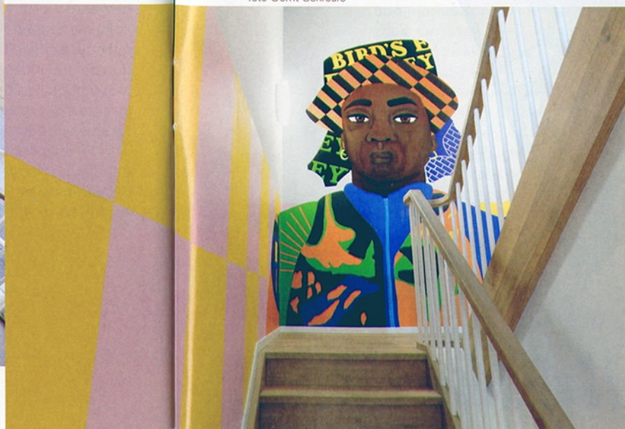
Iriée Zamble en Opperclaus, Birds Eye View of the Works , 2022, Muurverf