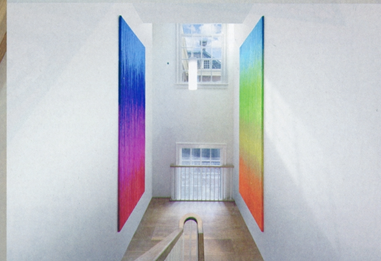
Joana Schneider, Spectrum , 2022, Vissertouw, draad van gerecyclede petflessen