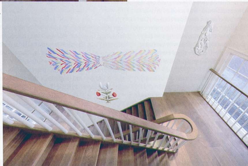
Femmy Otten, Ontklede dagen III , 2021/2022, Marmer, tempera